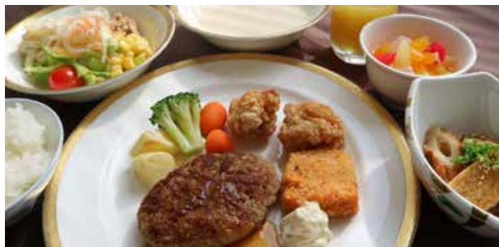
※写真は御膳イメージ