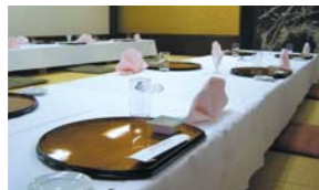
和室宴会場「秋の陣」